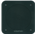
Art. No. 4639 **)

Wasserfester 8 cm (3,3") Breitbandlautsprecher mit transparenter Kunststoffmembran und Gummidichtring. Hoher Kennschalldruckpegel und flache Bauform. Optimiert für Sprach- und Signalwiedergabe.