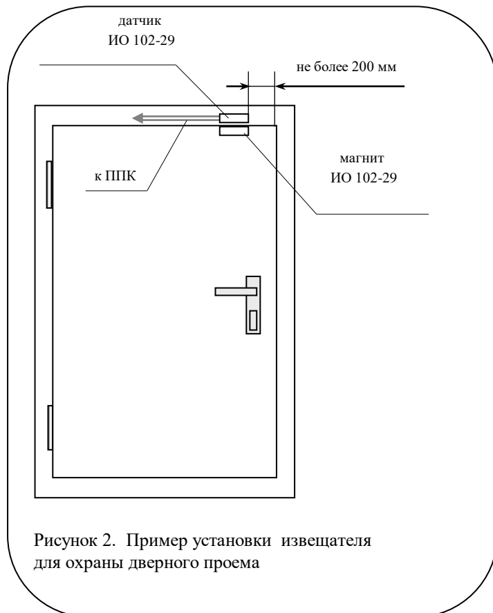
Рисунок 2. Пример установки извещателя для охраны дверного проема