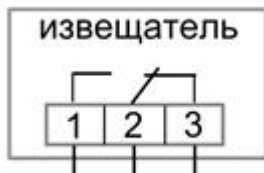
Рисунок 2б. Схема подключения ИО102-51(П)

(контакты 1 и 2 замыкаются под действием магнита)