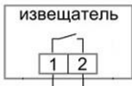
Рисунок 2а. Схема подключения ИО102-51(НР)

(контакты 1 и 2 замыкаются под действием магнита)