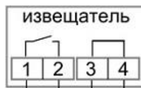
Рисунок 2в. Схема подключения ИО102-51(НР+Пр)

(контакт 2 под действием магнита размыкается с контактом 3 и замыкается с контактом 1. 1-красный, 2-черный 3-синий)