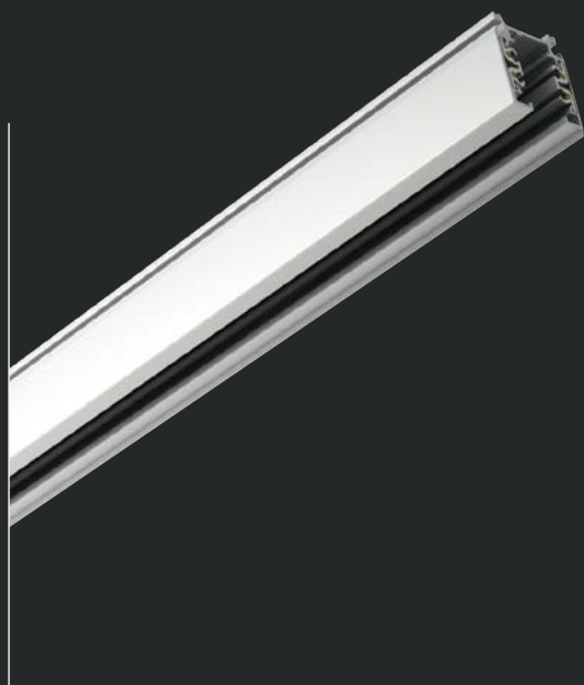
Готовые крепежные отверстия внутри шинопроводов