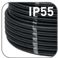
Степень защиты IP55

Гофрированные трубы FRHF не содержат в своем составе галогенов, вредных для здоровья человека, производятся из высококачественного негорючего композита и не распространяют горение. Рекомендованы к применению в местах массовых скоплений людей.