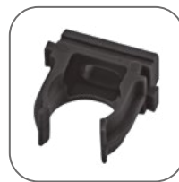
Все необходимые аксессуары