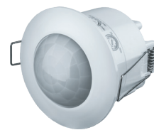
NS-IRM07-WH 1200 Вт, IP33, 360°, 6 м