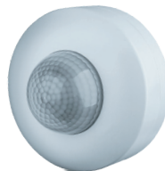
NS-IRM08-WH 1200 Вт, IP33, 360°, 12 м