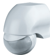
NS-IRM06-WH 1200 Вт, IP44, 180°, 12 м