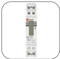
Компактный корпус всего в 1 модуль (18 мм)

Счетчики электрической энергии SKAT EKF PROxima непосредственного включения предназначены для учета потребленной активной энергии в однофазных цепях переменного тока.