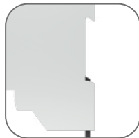
Крепление на DIN-рейку 35 мм