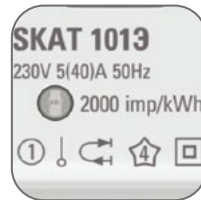
Класс точности 1