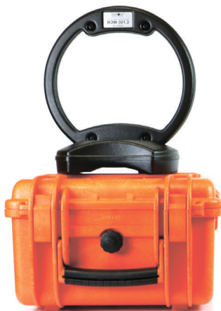
Генератор АГ - 120ТМ