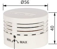
Регулятор уровня звука Модель: MPZ-56G, MPZ-56H