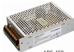
ARS-150 ARS-200 ARS-250