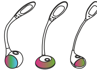
GLTL-035 GLTL-036 GLTL-037