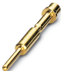
Crimpcontact, gedraaid, enkelvoudig contact, contactdiameter: 1 mm, crimpbereik: 0,14 mm 2 ... 0,5 mm 2

Houd er a.u.b. rekening mee dat de hier aangegeven gegevens uit de online catalogus afkomstig zijn. De volledige informatie en gegevens vindt u in de gebruikersdocumentatie. De Algemene gebruiksvoorwaarden voor internet-downloads zijn van toepassing. ( http://phoenixcontact.nl/download )