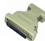
DB9M-DB25F переходник для мыши, RS-232