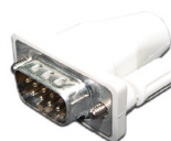
AD-008 переходник для мыши DB 9M - miniDIN 6F