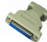
DB9F-DB25M переходник для мыши, RS-232