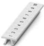
Zackband, Streifen, weiß, beschriftet, längs bedruckt: fortlaufende Zahlen 1 ... 10, 11 ... 20 usw. bis 491 ... 500, Montageart: verrasten in hoher Schildchennut, für Klemmenbreite: 5,2 mm, Schriftfeldgröße: 5,15 x 10,5 mm

Zackband - ZB 5,LGS:FORTL.ZAHLEN - 1050017