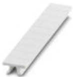
Zackband, bestellbar: streifenweise, weiß, beschriftet nach Kundenangaben, Montageart: verrasten in hoher Schildchennut, für Klemmenbreite: 5,2 mm, Schriftfeldgröße: 5,15 x 10,5 mm

Zackband - ZB 5,LGS:FORTL.ZAHLEN - 1050017