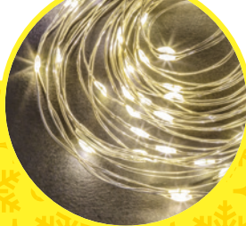
Роса, тёплый белый свет