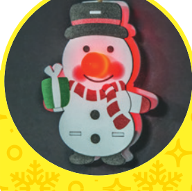
Снеговик, красный свет