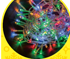
ПВХ прозрачный провод, RGBY