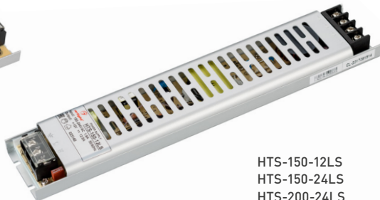
HTS-150-12LS HTS-150-24LS HTS-200-24LS