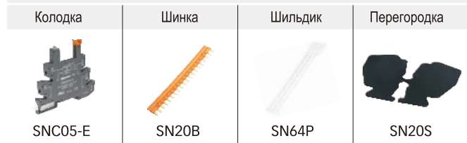
Таблица подбора реле и аксессуаров