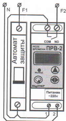
Монтажная схема подключения реле

143002, Россия, Московская обл., г. Одинцово, ул. Акуловская, 11а/стр. 3. Тел. +7(495)510-32-43