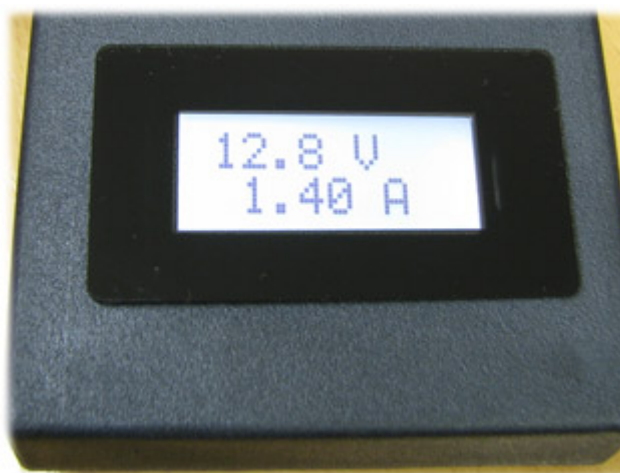
Фотография модуля SVAL0013, встроенного в корпус, до установки лицевой панели.