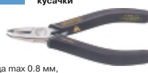
3-906-13 антистатические кусачки

Ø провода max 0.8 мм, L=125 мм, вес 80 г.