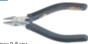
3-603-13 антистатические кусачки

Ø провода max 0.8 мм, L=120 мм, вес 65 г.