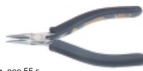
3-633-13 антистатические плоскогубцы