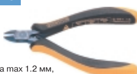
3-651-15 антистатические кусачки

Ø провода max 1.2 мм, L=120 мм, вес 55 г.