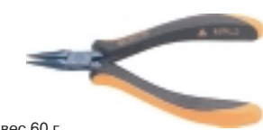
3-683-15 антистатические плоскогубцы