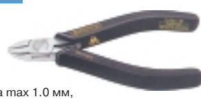
3-901-13 антистатические кусачки

Ø провода max 1.0 мм, L=125 мм, вес 75 г.