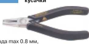
3-905-13 антистатические кусачки

Ø провода max 0.8 мм, L=125 мм, вес 80 г.