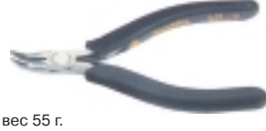
3-634-13 антистатические плоскогубцы угловые