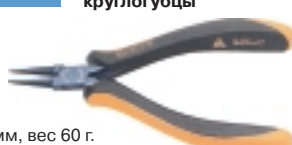
3-681-15 антистатические круглогубцы