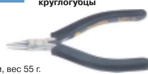
3-631-13 антистатические круглогубцы