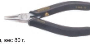
3-933-13 антистатические плоскогубцы