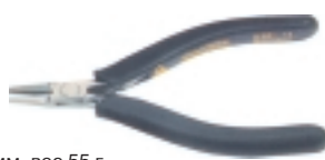
3-632-13 антистатические плоскогубцы