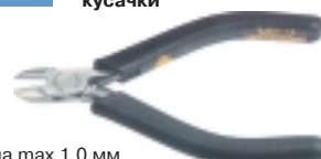
3-602-13 антистатические кусачки

Ø провода max 1.0 мм, L=120 мм, вес 70 г.