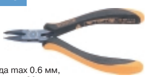
3-671-15 антистатические кусачки

Ø провода max 0.6 мм, L=130 мм, вес 60 г.