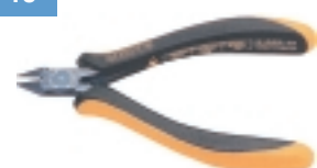
3-652-15 антистатические кусачки

Ø провода max 1.0 мм, L=120 мм, вес 55 г.