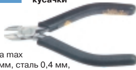
3-601-13 антистатические кусачки

Ø провода max медь 1.0 мм, сталь 0,4 мм, L=120 мм, вес 70 г.