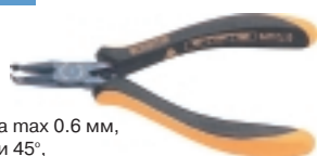
3-674-15 антистатические кусачки

Ø провода max 0.6 мм, угол резки 45°, L=130 мм, вес 60 г.