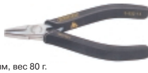
3-932-13 антистатические плоскогубцы