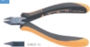
3-653-15 антистатические кусачки

Ø провода max 1.0 мм, L=120 мм, вес 55 г.