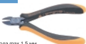
3-655-15 антистатические кусачки

Ø провода max 1.5 мм, L=125 мм, вес 60 г.