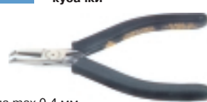
3-606-13 антистатические кусачки

Ø провода max 0.4 мм, L=120 мм, вес 55 г.