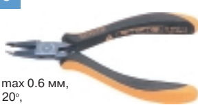
3-672-15 антистатические кусачки

Ø провода max 0.6 мм, угол резки 20°, L=130 мм, вес 60 г.