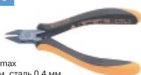
3-656-15 антистатические кусачки

Ø провода max медь 1.2 мм, сталь 0,4 мм, L=125 мм, вес 60 г.