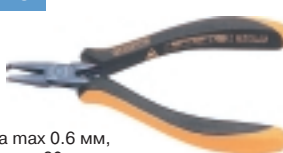
3-673-15 антистатические кусачки

Ø провода max 0.6 мм, L=130 мм, вес 60 г.