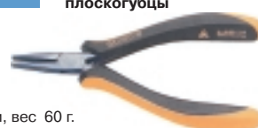
3-682-15 антистатические плоскогубцы