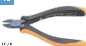
3-654-15 антистатические кусачки

Ø провода max медь 1.5 мм, сталь 0,4 мм, L=125 мм, вес 60 г.