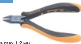
3-657-15 антистатические кусачки

Ø провода max 1.2 мм, L=125 мм, вес 60 г.