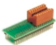
DIP40-DIP16 адаптер для программатора "Мастер"

Адаптер для программирования микросхем в корпусе SOIC-8.