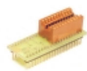
DIP40-DIP20 адаптер для программатора "Мастер"

Адаптер для программатора "Мастер". Предназначен для программирования микросхем, в корпусе DIP-18. Поддерживает микроконтроллеры фирмы MICROCHIP серии PIC16xxx.