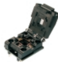
AA006 адаптер для программирования DIP- PLCC32

Адаптер для программирования микросхем в корпусе PLCC-32.