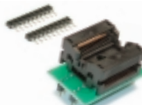
DIP28 - SOIC28 300mil переходник

Универсальный адаптер (с распайкой один в один) для программирования микросхем в корпусе SSOP - 28.