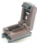
AB005 адаптер для программирования DIP-SO20

Универсальный адаптер для программирования микросхем. В корпусе SOIC шириной 7,5 мм.