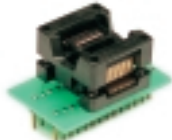
AE-SP28U адаптер (DIP- SSOP 28)

Адаптер для программирования микросхем памяти в корпусе PLCC - 32.