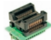
AE-SC18/28U адаптер (DIP-SO18/SO28)

Адаптер для программирования микросхем в корпусе SOIC - 28.