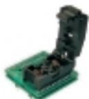
AB002 адаптер для программирования DIP-SO8

Адаптер для программирования микросхем в корпусе SOIC - 8 (широкий).