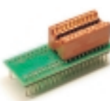
DIP40-DIP18 адаптер для программатора "Мастер"

Адаптер для программатора "Мастер". Предназначен для программирования микросхем в корпусе DIP16, поддерживает микросхемы EEPROM памяти фирмы MICROCHIP, 24Cxxx, 93Cxxx.