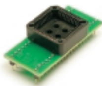
DIP40 - PLCC44 MCS-51 переходник

Адаптер для программирования микроконтроллеров семейства MCS - 51 в корпусе PLCC - 44. Поддерживает микроконтроллеры семейства MCS - 51 фирм ATMEL, DALLAS, HYNIX, INTEL, PHILIPS, WINBOND и др.