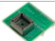
DIP32-PLCC32 адаптер (2xC010-2xC080)

Универсальный адаптер (с распайкой один в один) для программирования микросхем в корпусе PLCC-32, поддерживает микросхемы памяти фирм AMD, ATMEL, CATALIST, HITACHI, HOLTEK, INTEL, SSI, WINBOND и др.