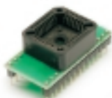
DIP28 - PLCC32 EEPROM 512k переходник

Адаптер для программирования микросхем памяти в корпусе PLCC-32, поддерживает микросхемы: 27C64 - 27C512 28X64 - 28X512 29X64 - 29X512.