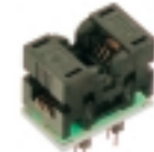
DIP8-SOIC8 200 mil переходник

Адаптер для программирования микросхем в корпусе SOIC-8 (узкий).