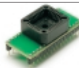
DIP32 - PLCC32 FLASH, EEPROM переходник

Адаптер(2xC010-2xC080) для программирования микросхем памяти в корпусе PLCC - 32, поддерживает микросхемы: 27C010 - 27C080 28F010 - 28F080 29X010 - 29X080.