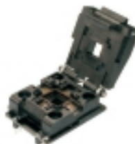
AA004 адаптер для прог- раммирования DIP-PLCC32

Адаптер для программирования микроконтроллеров семейства MCS-51 в корпусе PLCC - 44.