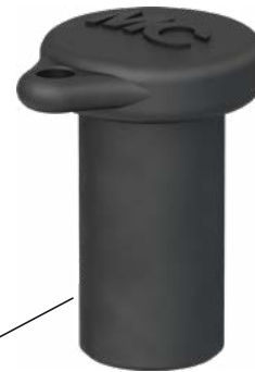
Buchsen-Verschlusskappe Sealing cap for female cable coupler

Typ/Type: PV-SVK4 Bestell-Nr./Order No.: 32.0716