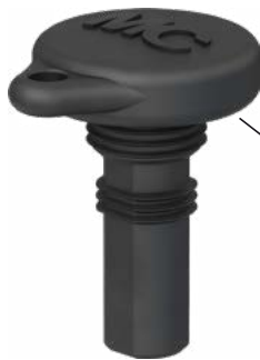
Stecker-Verschlusskappe Sealing cap for male cable coupler

Typ/Type: PV-SVK4 Bestell-Nr./Order No.: 32.0716